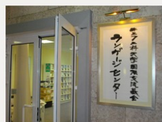
UAJC日本語図書館の入り口

ウクライナ日本センター（以下、UAJC）は2006年に国際協力機構（JICA）によってキエフ工科大学（以下、KPI）の中に開設されました。2011年5月に5年間のJICAプロジェクトが終了し、その後は国際交流基金（以下、JF）が日本語教育事業と文化交流事業を引き継ぎました。現在UAJCでは教室増設工事が進行中で、来年度の新学期9月からは3教室新たな教室を使用する