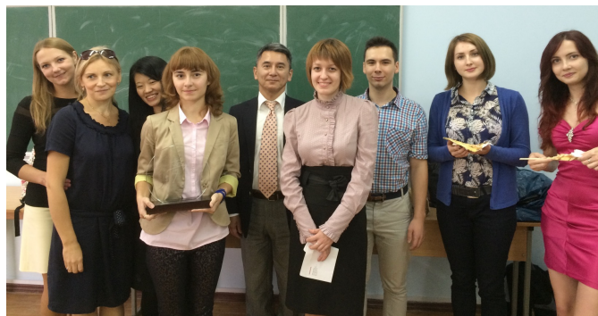
国際交流基金 日本語教育 国・地域別情報「ウクライナ（2020年年度）」

https://www.jpf.go.jp/j/project/japanese/survey/area/country/2020/ukraine.html